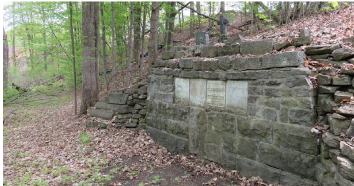
Figure 1. Caveau des Stevenson dans la Section 61 comme il apparaît aujourd'hui, avec les vestiges du chemin d'origine. La porte bouchée est visible sous les deux plaques d'inscription centrales.